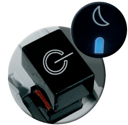
Coupure automatique de l'électricité automatique

Deux réceptacles distincts et amovibles pour séparer le papier du plastique **En Option**