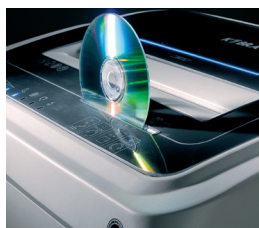
Deux séries de couteaux: une pour le déchiquetage du papier l'autre pour les CD's

Intégré, Dispositif de lubrification automatique de la lame.