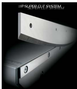
SYSTEME "SUPER CUT"

Lames et contre-lames en acier trempé au carbone avec un aiguisage à 65 ° pour des opérations de coupe durables.