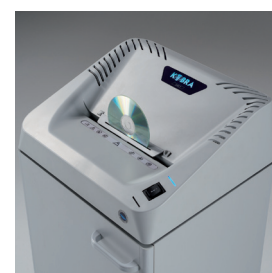
Démarrage automatique et déchetage de CD

système de gestion avec indicateurs lumineux d'économie d'énergie en mode veille